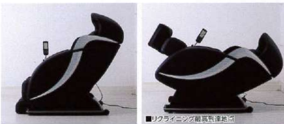
■リクライニング範囲到達地点

背もたれ、座面、オットマンが同時に動き、身体がまるで無重力状態の中でマッサージをするかのような感覚のリクライニング機能です。人間工学に基づき、頭、体、腰、脚、足先を体に負担のかからない位置をキープします。今までにない身体を包みこむようなホールド感を実現しました。