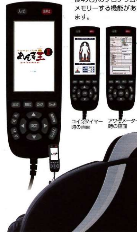
コインタイマー 時の画面

リモコンはカラー液晶画面でマッサージの状況が一目で判ります。自動コースは身体の調子に合わせたコースを選べます。自分にあつた微調整もお好みで出来ます。さらに業務用として利用する際に必要なコインカウンター、アワーメーター、さらにエラーコード表示機能で故障が生じた際にも的確な判断が可能になりました。また家庭用仕様には4人分のプログラムをメモリーする機能があります。