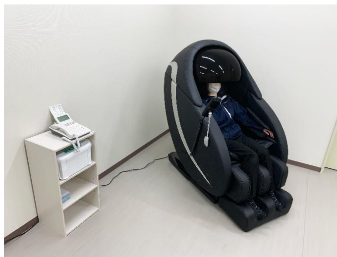
設置されたマッサージチェア「あんま王Ⅳ」でくつろぐ社員